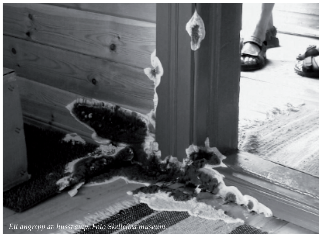
Ett angrepp av hussvamp.

Har du hittat något misstänkt i huset så är den första åtgärden att identifiera och stoppa vattenkällan. Därefter kan man åtgärda skadorna. Man måste åtgärda orsaken, inte bara symptomen. Komplettera vid behov med en kemisk sanering. Detta görs oftast med fungicid som innehåller bor. Det bästa är dock att förebygga angrepp enligt följande: