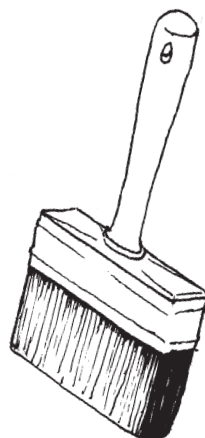
Nutida plafondpensel. Har en mycket vid användning, företrädesvis för vattenbaserade färger. Ill. Bertil Bonns.

Patentering är att isolera och binda den gamla färgen med starkt förtunnad olje- eller alkyd-baserad grundfärg. Mycket förtunning behövs för att bindemedlet skall tränga igenom det gamla limfärgskiktet, vanligt har också varit en tillsats med kokt linolja. Nackdelen är mängden med lösningsmedel som avdunstar när det är större ytor som ett tak, så det kan rekommenderas att en sådan behandling utförs sommartid med öppna fönster. Sammansättningen på patenteringsfärg kan variera, en förekommande blandning har varit lika delar alkydgrundfärg, kokt linolja och lacknafta. En annan fördel med patentering före nymålning med limfärg är att den väsentligt underlättar nedtvättning vid följande ommålning.